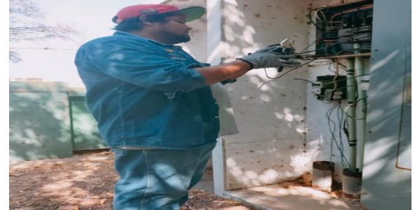
3.2.- Se le dio mantenimiento a la pastilla termo magnético del centro de carga de la unidad deportiva Jaime Tubo Gómez.