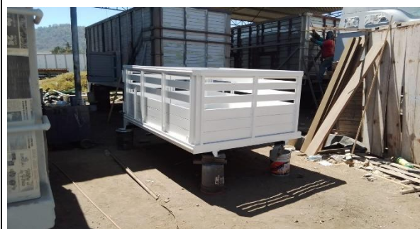
3.1.- se fue revisar la redila para la nueva camioneta.