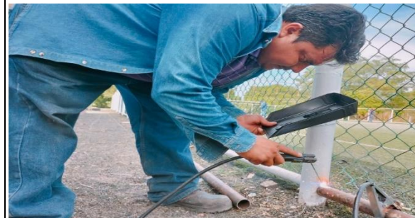
3.7.- Se continuó con el mantenimiento del campo de futbol 7 de la unidad deportiva Jaime Tubo Gómez.