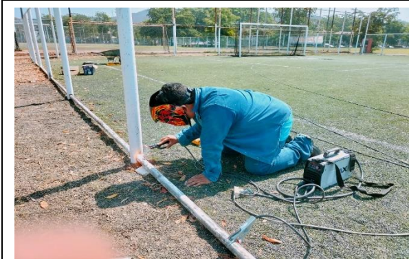
3.3.- Se siguió con el mantenimiento de la tubería y alambrado del campo de futbol 7 de la unidad deportiva Jaime "tubo" Gómez.