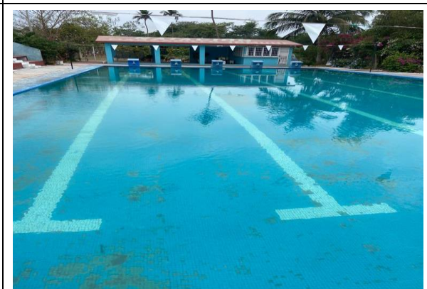
3.7.- Se le dio mantenimiento a la Alberca.