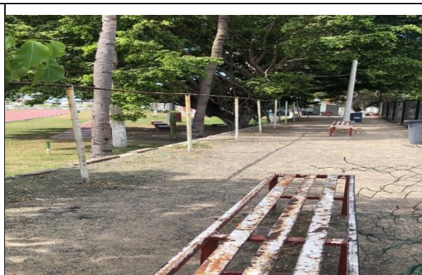
3.6.- Se quitó la malla que separa del campo de futbol 7 y las áreas verdes junto a la pista de tartán de la unidad deportiva 5 de mayo.