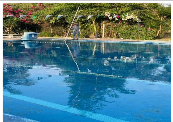
3.14 – Se le dio mantenimiento a la Alberca.