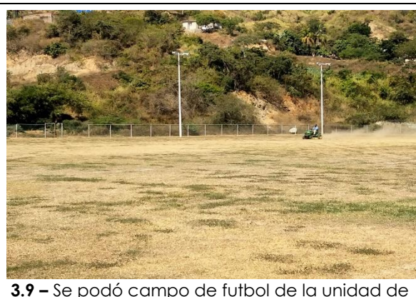
3.9 – Se podó campo de futbol de la unidad de La Cima.