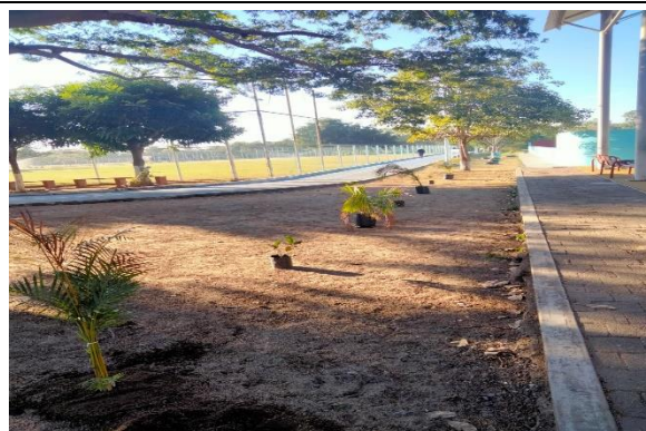
3.2 – Se plantaron palmas dentro de la unidad Tubo Gómez.