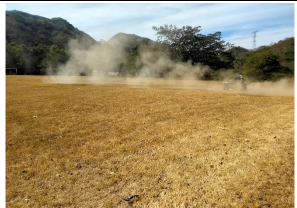
3.4 – Se podó campo de futbol de EL Charco.