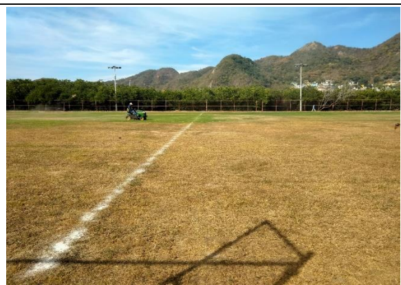
3.8 – Se podó campo de futbol de la Alameda.