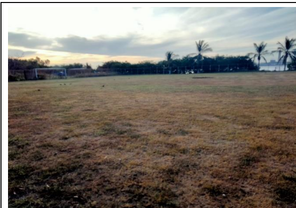
3.7 – Se podó campo de futbol de la Pedregosa.