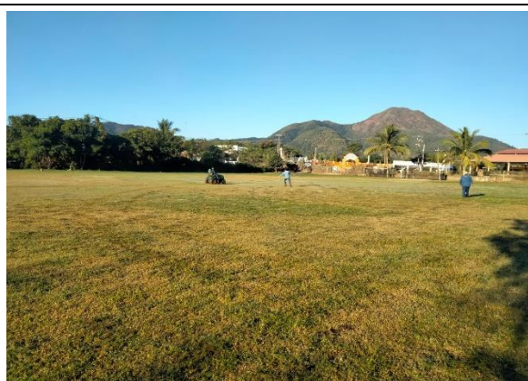
3.1 – Se podó campo de fútbol de El Naranjo.