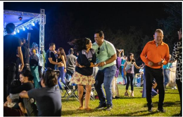
2.- Tercer festival cultural rural en el campo de futbol de Canoas.