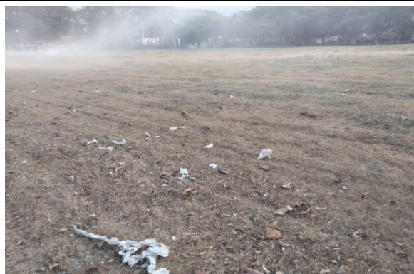
3.11 - Se podó campo de futbol de San Buenaventura.