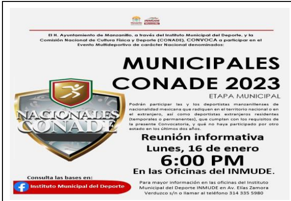
1.1 Reunión Informativa.