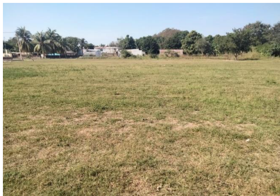
3.13 – Se podó campo de futbol de Santa Rita.