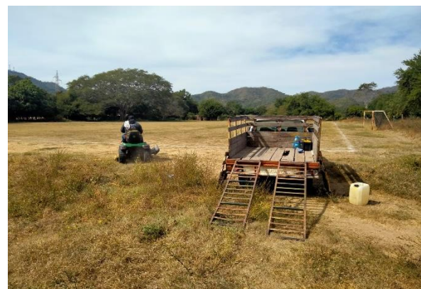
3.5 – Se podó campo de futbol de La Central.