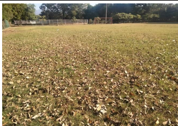
3.12 - Se podó campo de futbol de V. Carranza.