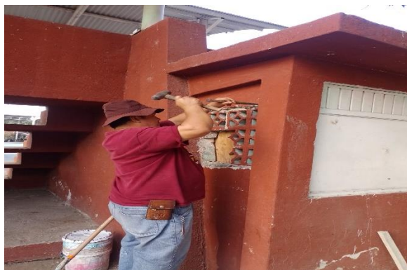
3.10 – Se tapó con cemento una ventana de los baños de la unidad Padre Hidalgo.