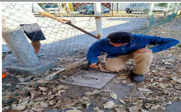
3.6 – Se checo que estuvieran las pastillas, en la cancha de usos múltiples del barrio 1 ya que los reflectores no sirven.