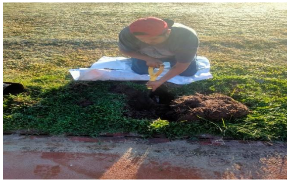
6.14.-Se reparó una fuga de agua adentro del campo de fútbol Héctor Hernández de la 5 de mayo