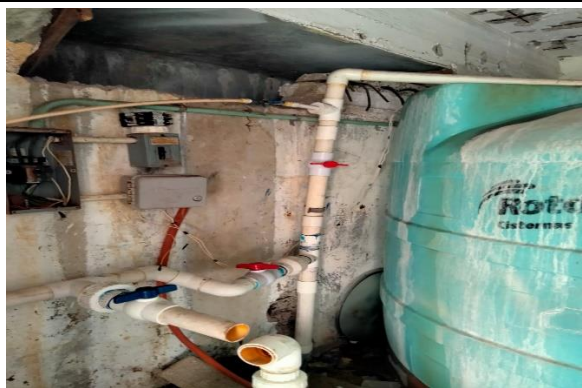
6.13.- Se reparó una fuga de agua en el tinaco de riego de la 5 de mayo.