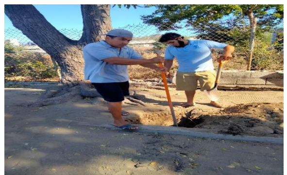
6.7.- Se le pidió el apoyo a capdam para habilitar las tomas de agua para regar las canchas de voleibol en la playa de San Pedrito