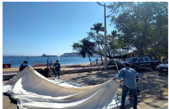
6.6.- Se apoyó en la playa de San Pedrito para colocar los toldos