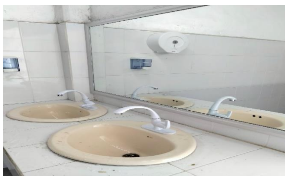
6.17.- Se cambiaron las llaves de los baños en la unidad 5 de mayo que se encuentran abajo de las gradas.