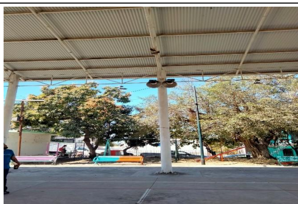
6.10.- Se hizo un recorrido para checar el sistema de alumbrado de varias canchas