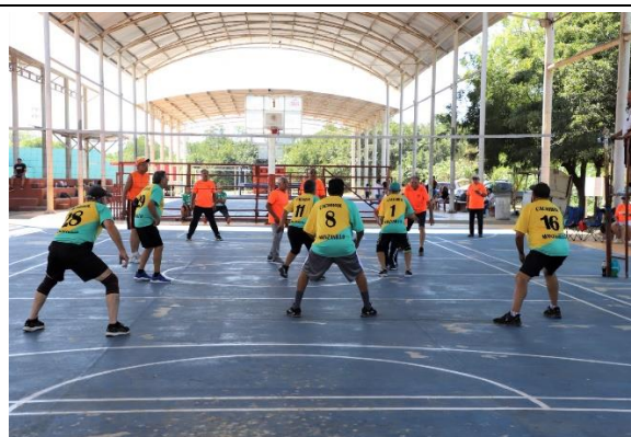
3.- Se llevó a cabo el 1er. Torneo de Cachibol en la Tubo Gómez.