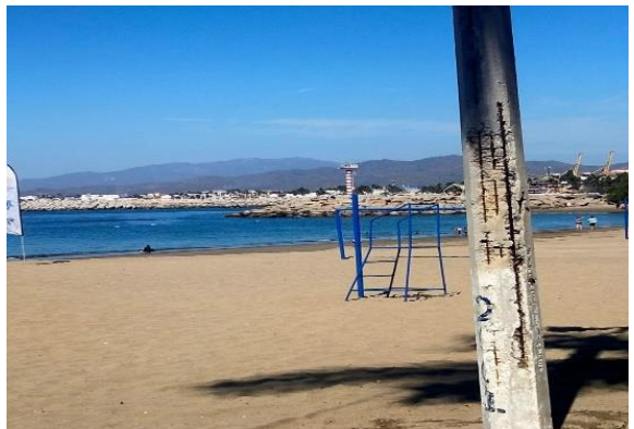
6.5 Se pintaron las torres Se llevaron las torres de los árbitros de voleibol de la tubo Gómez a la playa de San Pedrito