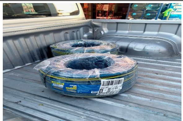
6.8.- Se compraron 200 m de manguera para el evento de la playa de San Pedrito