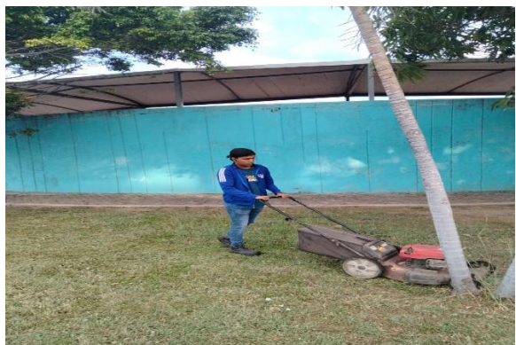
6.2.- Se apodó alrededor del campo de béisbol de la 5 de mayo