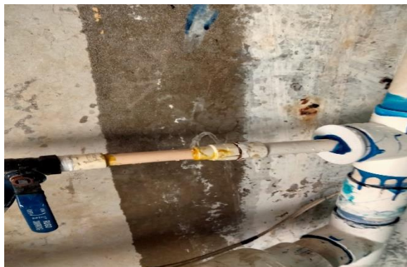
6.19.- Se reparó una fuga de agua en el tinaco de los baños de la unidad 5 de mayo.