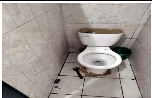
6.1.- Se cambió una llave angular de un baño de los hombres de la Tubo Gómez.