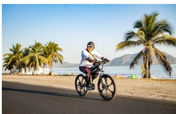
2.- Corredor Recreativo Miramar.