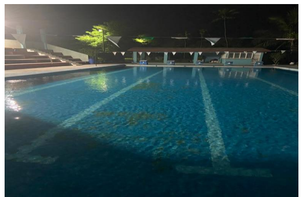
6.21.- Se le dio mantenimiento a la Alberca municipal, ubicada en la unidad deportiva 5 de Mayo.