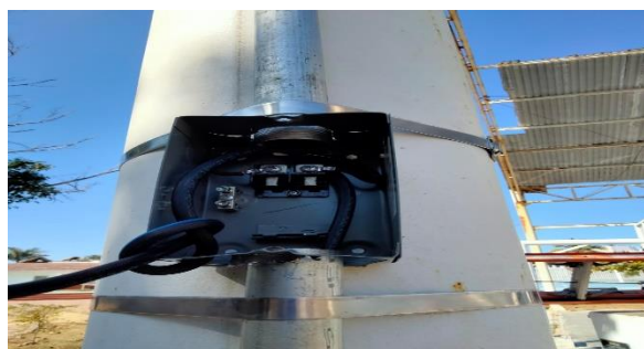
6.9.- Con apoyo de alumbrado público se colocó un centro de carga con tubería reforzada para las lámparas led, en la cancha de básquetbol de la unidad 5 de mayo