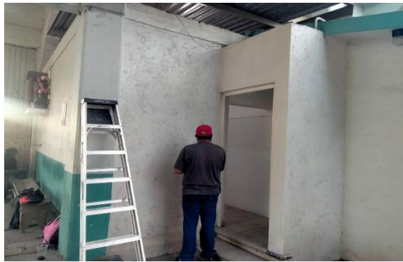
6.18.- Se pintó abajo de las gradas del campo Héctor Hernández en la 5 de mayo a un lado de las bodegas.