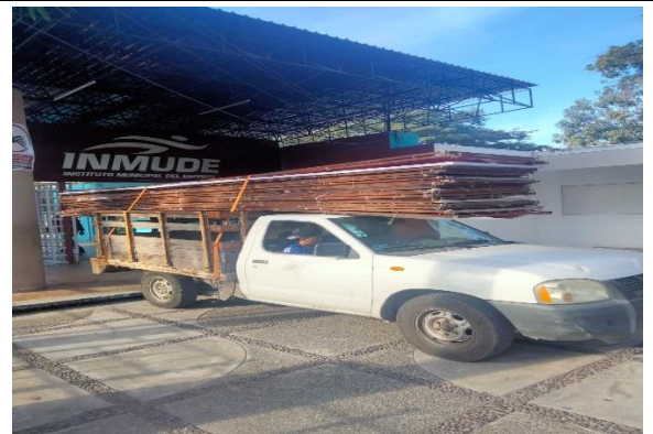
6.4. Se llevaron las vallas de la tubo Gómez a San Pedrito para el evento en la playa.