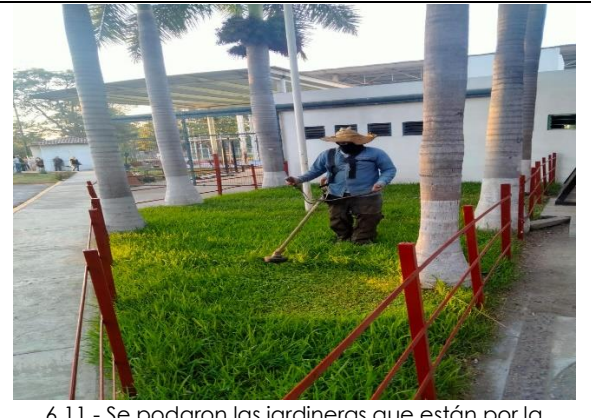
6.11.- Se podaron las jardineras que están por la entrada principal a la Unidad Tubo Gómez.