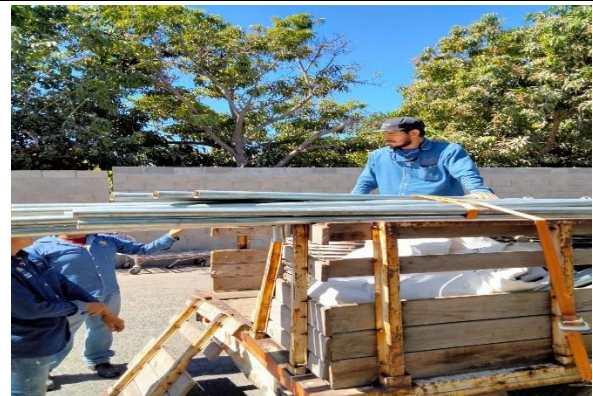
6.16.- Se recogieron los toldos de seguridad pública y se llevaron al casino de la feria a entregar