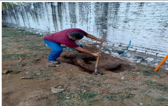
6.3.- Se continuó con los pozos para poner los postes a un lado del parkour, en la unidad 5 de Mayo.