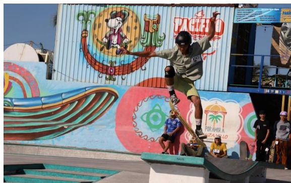
4.- Se llevó a cabo la etapa estatal de skateboarding en el skatepark de Miramar.