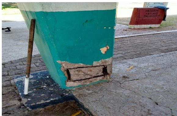
6.15.- Se reparó un castillo que estaba en mal estado en la unidad 5 de mayo