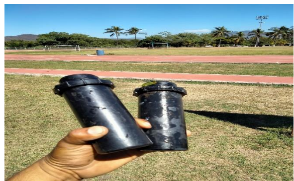
6.20.- Se cambió un aspersor, en el campo de fútbol Héctor Hernández donde estaba la fuga, ya que no funcionaba.