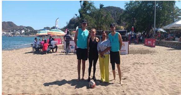
5.- Se llevó a cabo la etapa estatal de voleibol de playa en la playa de San Pedrito.