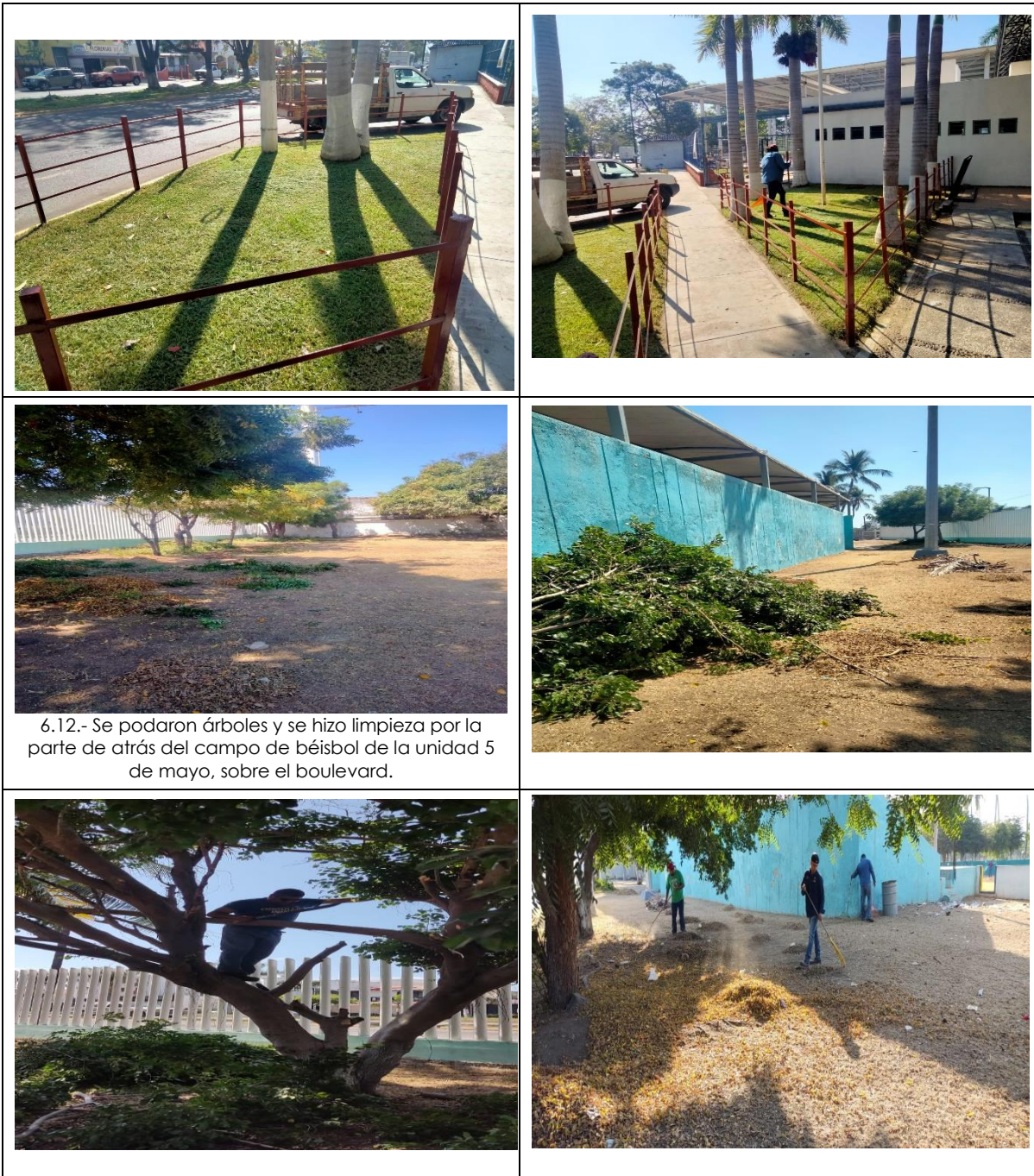
6.12.- Se podaron árboles y se hizo limpieza por la parte de atrás del campo de béisbol de la unidad 5 de mayo, sobre el boulevard.