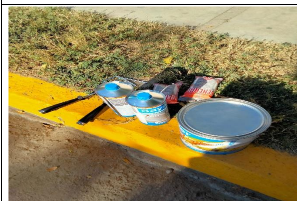
2.5 - Se entregó material a seguridad pública para pintar las porterías para el evento de la playa.