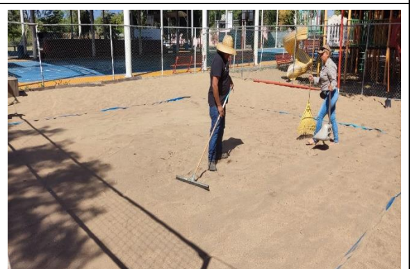
2.2 – Se le dio mantenimiento a la cancha Voleibol