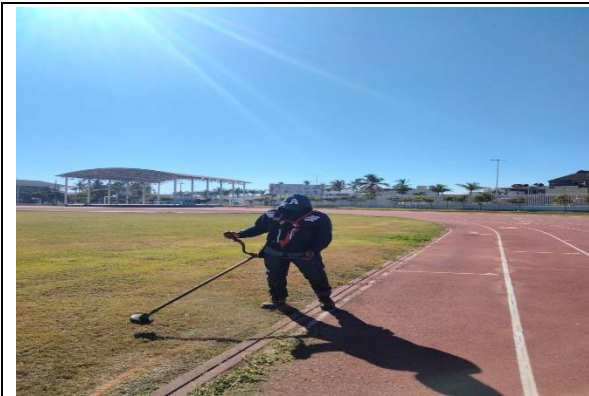
2.10 – Se podó y desbrozó el campo de futbol Héctor Hernández de la 5 de Mayo.