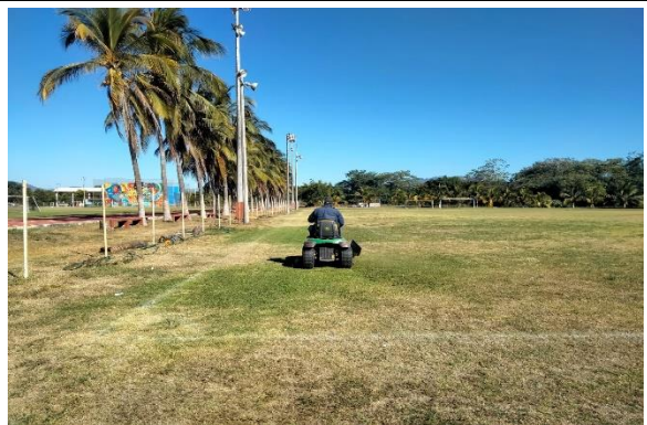
2.9 – Se podó campo de futbol Panchito Leal de la unidad 5 de Mayo.