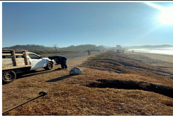
2.7 – Se desbrozo sobre el camellón de la playa Miramar.