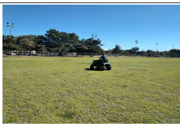
2.6 - Se podó campo de fútbol Rigo Reyes de la unidad Tubo Gómez.