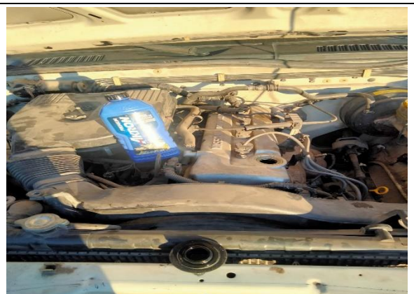
2.8 – Se rellenó de aceite la camioneta.