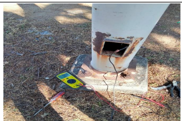
2.12 – Se reparó un corto circuito de la cancha de usos múltiples de Parque Metropolitano.