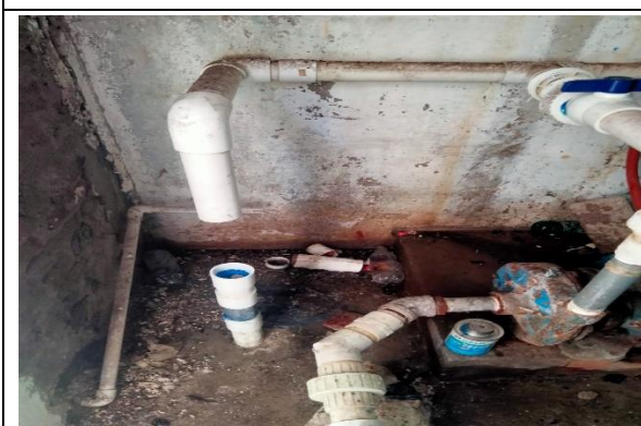
2.3 – Se reparó una fuga de agua del tinaco de la 5 de Mayo.