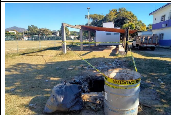
2.11 – Se colocó una cinta de precaución en fosa del campo de futbol del barrio 2.