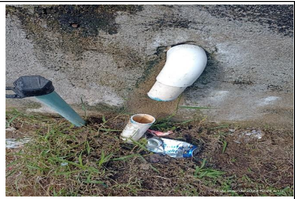
2.1 – Se reparó una fuga de agua de la bomba de riego de la unidad deportiva 5 de mayo.