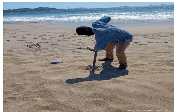
2.13 – Con apoyo de Seg. Pública se colocaron las porterías en la playa Miramar para el evento.