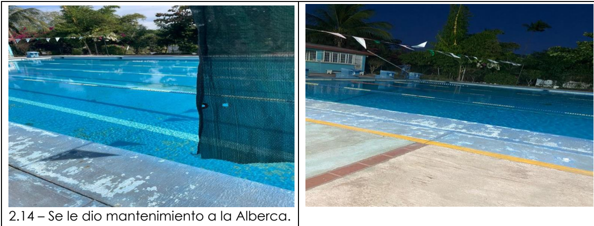
2.14 – Se le dio mantenimiento a la Alberca.