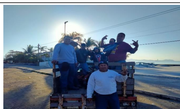
2.4 - 2.4 – Se hizo una brigada de limpieza en los camellones de la playa de Miramar para el evento que se llevara a cabo el fin de semana, "Corredor Recreativo Miramar"