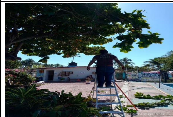
3.7 - Se le dio mantenimiento a las áreas verdes de la alberca.