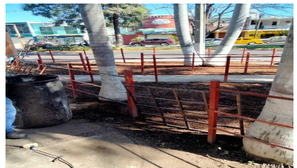
3.3 - Se soldaron varias partes de las jardineras que estaban desoldadas de la entrada principal de la Unidad Tubo Gómez.