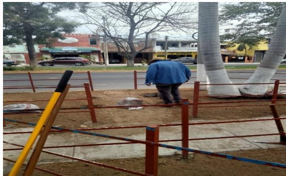
3.2- Se colocó arena en las jardineras de la entrada principal de la unidad Tubo Gómez para colocar el pasto.