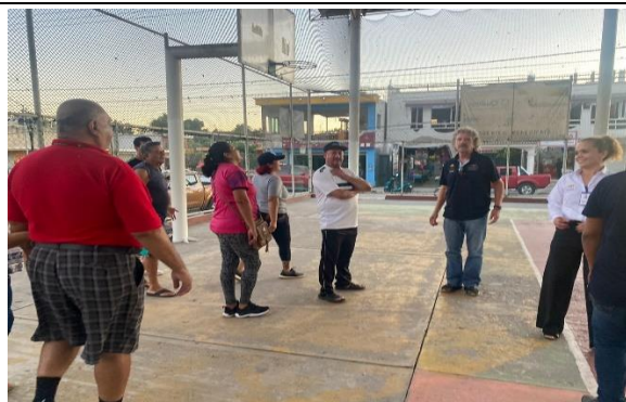
1.2 -La Directora, y parte de su equipo se presentaron en la delegación de El Colomo, con los jugadores de Cachibol,