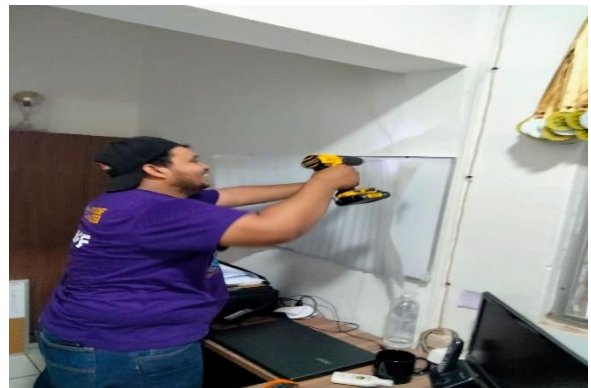
3.5 - Se instaló un pizarrón en la oficina del contador del inmude.