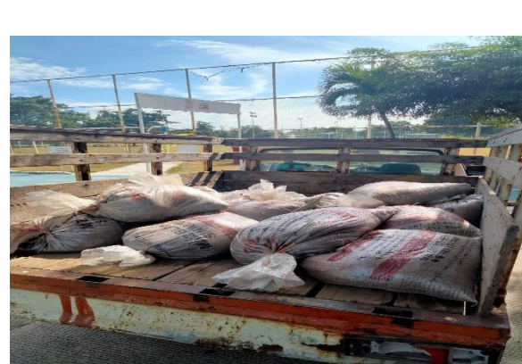
3.1 – Se compró arena para colocar pasto en las jardineras de la entrada principal de la unidad Tubo Gómez para colocar el pasto.