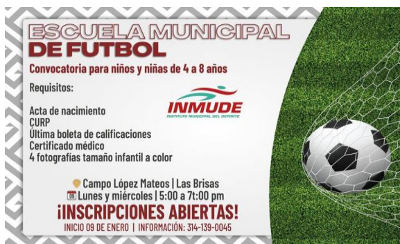
2.- Iniciaron las clases de la escuela municipal de futbol en el campo en el estadio López Mateos, impartidas por el profesor Eugenio De Obeso.