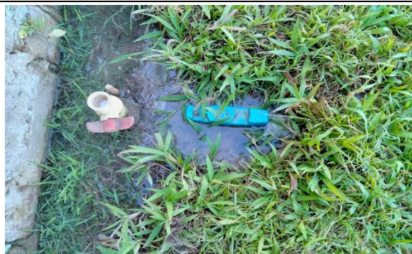
3.6 - Se repararon fugas de agua y se colocaron aspersores en el campo de futbol de canoas.